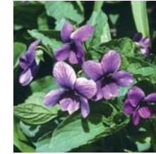
부시제비꽃의 일종 6월하순~7월상순