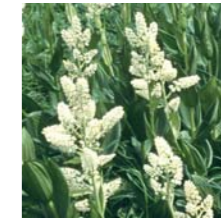
여로의 일종 7월상순~7월하순