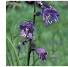
옥잠화의 일종 7월하순~8월하순