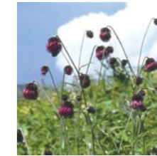
영경화의 일종(고유종) 8월상순~9월중순