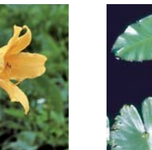
개연꽃의 토속종 7월중순~8월하순