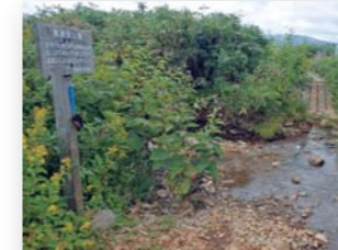
다습 초원 입구테라스